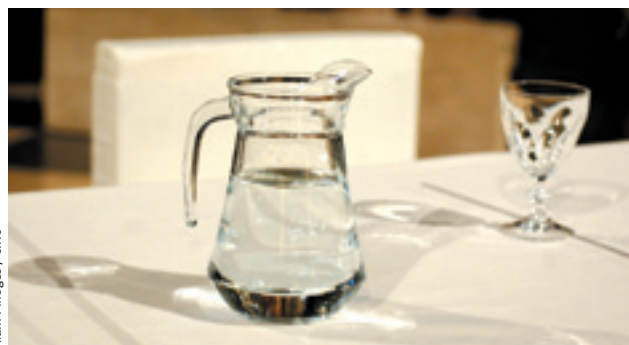
Alain Pinoges / cliché