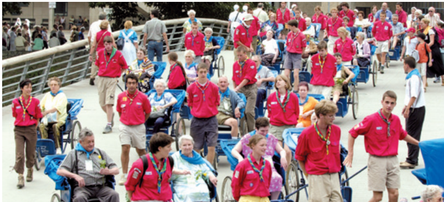
Des Scouts de France conduisent les malades à la messe à Lourdes.

Pas si facile de donner de son temps à l'adolescence, de se sentir solidaire de ceux qui sont dans le besoin. Comment aider un jeune à se tourner vers les autres, à s'ouvrir au partage ? La famille sert souvent d'exemple. Scoutisme, aumônerie, etc., les mouvements de jeunes et les établissements scolaires sont aussi de bons relais d'éducation à la solidarité.